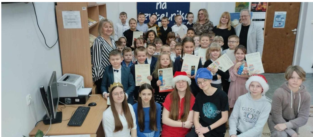
ZESPÓŁ SZKÓŁ SAMORZĄDOWYCH W JEDWABNEM

W Gminie Jedwabne funkcjonują dwie placówki oświatowe. W Jedwabnem wszystkie rodzaje funkcjonujących szkół skupione są w Zespole Szkół Samorządowych. Drugą placówką oświatową na terenie Gminy Jedwabne jest Szkoła Podstawowa w Nadborach.